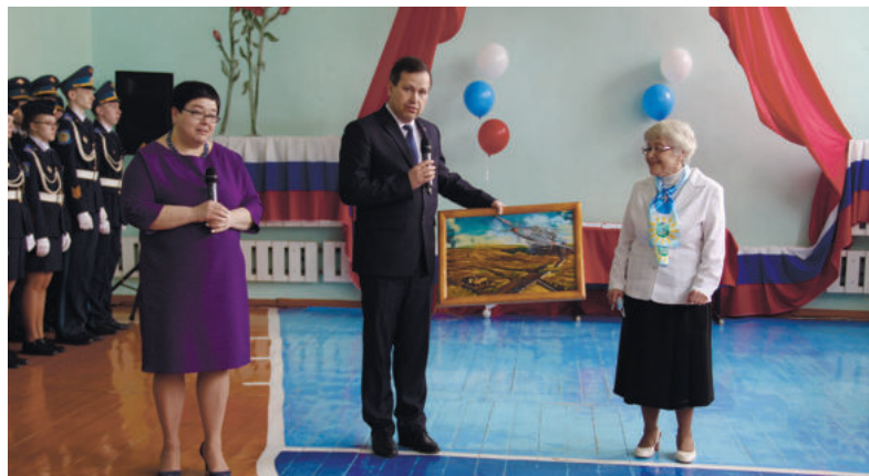
Кадетское братство Зайковской первой школы развивается. 16 ребят стали виновниками волнительного и значимого события

В конце прошлой недели, накануне Дня космонавтики, состоялось торжественное мероприятие посвящения в кадеты 16 пятиклассников Зайковской средней общеобразовательной школы №1 им. дважды Героя Советского Союза Г.А. Речкалова.