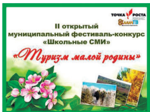
II открытый муниципальный фестиваль-конкурс среди школьников.

В этом году представителям школьных СМИ предлагалась одна общая тема для работы: «Туризм малой родины». Конкурс начинающих журналистов проводился по направлениям «Буклет-путеводитель», «Рекламный ролик», «Статья» и «Фото». В конкурсе принимали участие отдельные авторы – учащиеся образовательных учреждений общего и дополнительного образования Ирбитского района. Цель фестиваля-конкурса является содействие самореализации и развитию творческих способностей детей и подростков, выявление и поддержка одарённых детей, привлечение детей, подростков и молодежи к социальной активности, повышение уровня их медиакультуры. А также создание условий для профориентации детей и подростков, содействие