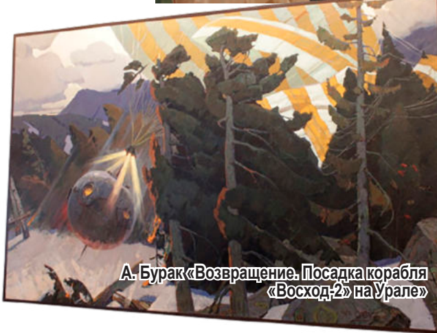
А. Бурак «Возвращение. Посадка корабля «Восход-2» на Урале»

снега в тайге была около двух метров, а температура опускалась до -29 °С. Спускаемый аппарат не был приспособлен к посадке в таких условиях.