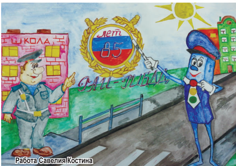
Работа Савелия Костина

Ирина Новгородова, МБУ ЦБС Ирбитского МО «Речкаловская сельская библиотека», фото автора