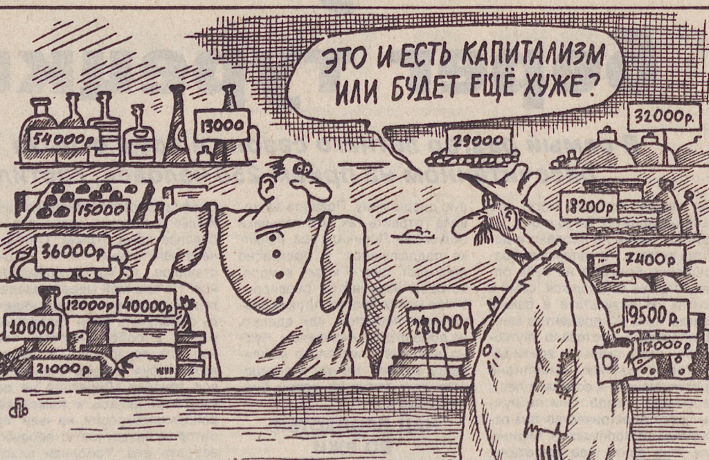
Рис. Михаила ЛАРИЧЕВА.