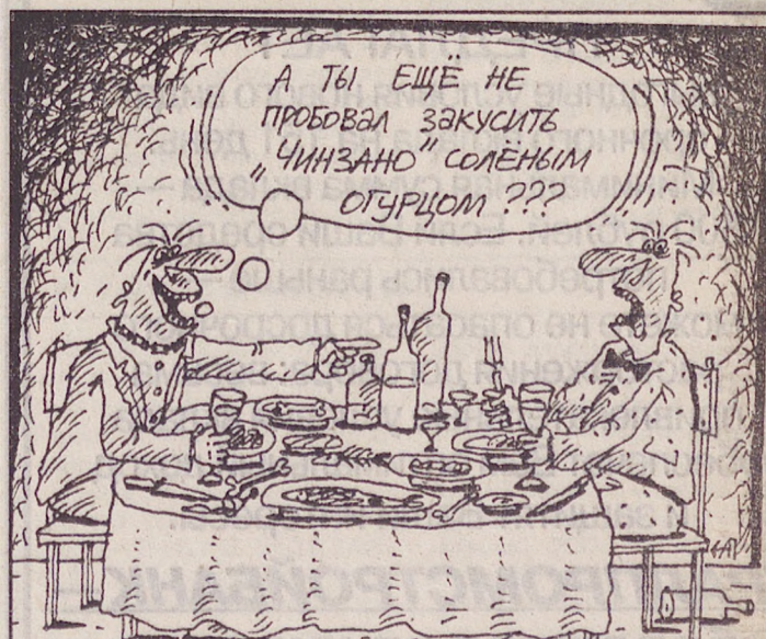
Рис. Аркадия ПЯТКОВА.