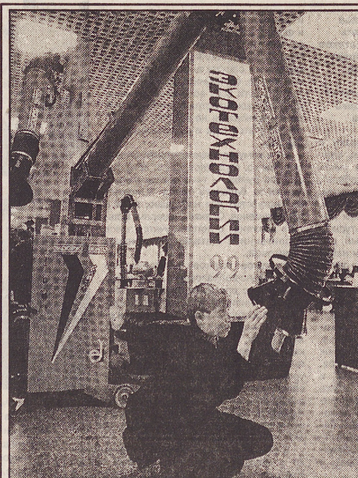
ОРЕНБУРГ. В городе прошла региональная выставка "Эко-технология-99", задача которой — объединить усилия различных ведомств и выбрать основные направления деятельности по сохранению природы на Южном Урале. Люди поняли, что одним только митингами экологию не спасешь.

НА СНИМКЕ: такие установки очистки воздуха производятся на многих предприятиях Оренбуржья.