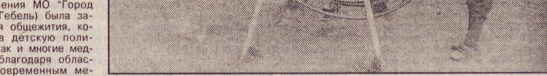
Губернатору пришлось объяснять некоторым работникам больницы, возмущенным низкой, не индексированной и с переборами выплачиваемой зарплатой, что не его, губернатора, и не правительства области это вина.

Еще одна забота облизбиркома — проверка жалоб на нарушения избирательного законодательства. "Фальстартом" признаны публикации в газетах "Наш дом — наш город", "Уральский обозреватель", "Комсомольская правда", начавших агитацию за