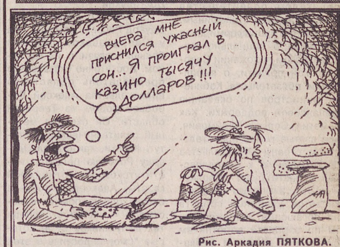
Рис. Аркадия ПЯТКОВА.

Погода Сухая жаркая погода сменится на неустойчивую теплую. Завтра по области ожидается облачность, местами — кратковременные дожди и грозы, ветер северо-восточный 2-7 м/сек. Температура воздуха ночью плюс 11... плюс 16, днем плюс 21... плюс 26 градусов.