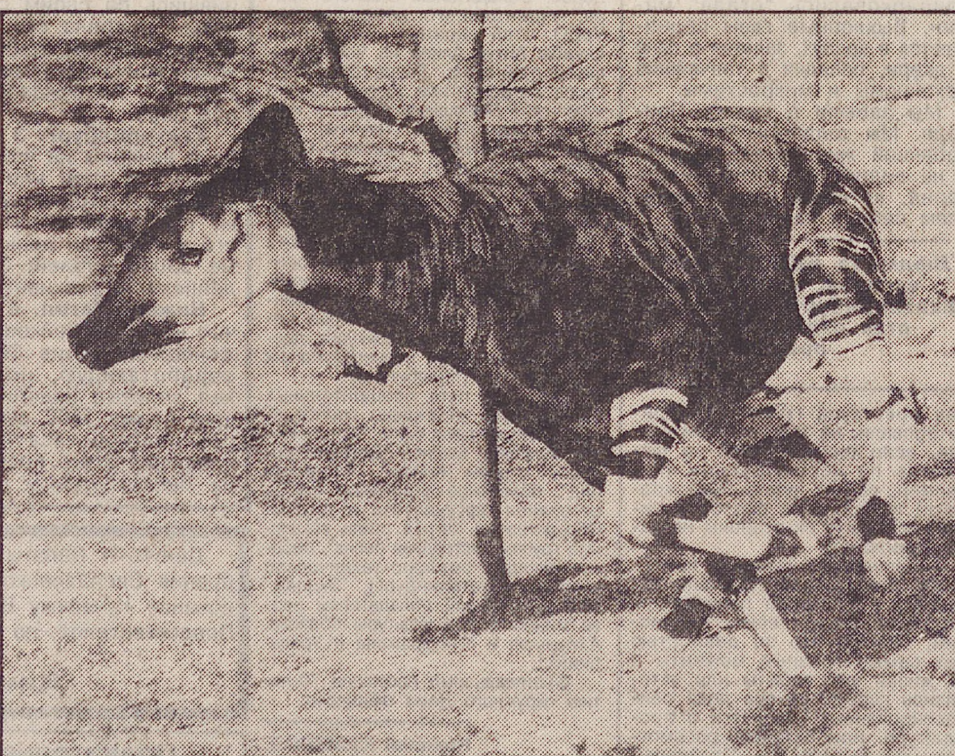
Япония: Африканский гость