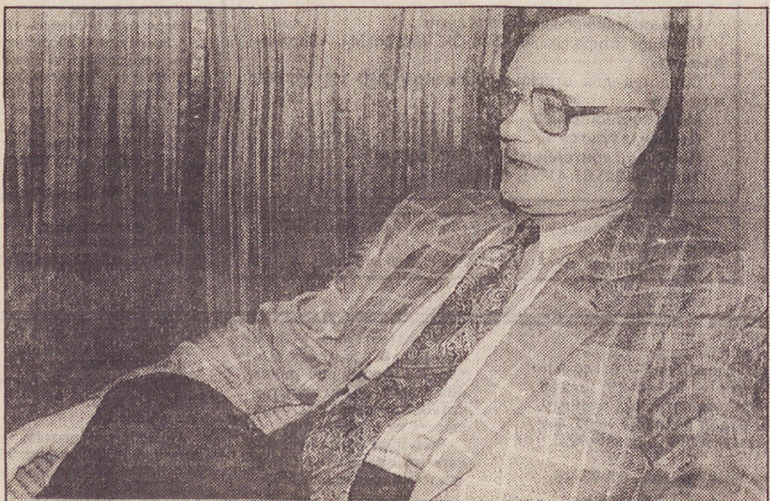
НА СНИМКЕ: член жюри кинофестиваля народный артист России Леонид Куравлев.