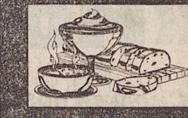
Рис на любой каприз

Из риса можно приготовить множество вкуснейших блюд. Главное для этого — сварить его правильно, зернышко к зернышку. Искусству приготовления риса на Востоке обучают с малолетства. А на острове Ява, например, все девушки перед тем как выйти замуж, должны сдать экзамен по варке риса. И хотя мы с вами не островитяне с Явы, попробуем все-таки научиться правильно варить рис.