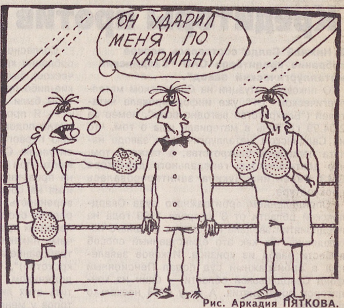
Рис. Аркадия ПЯТКОВА.

Из холодного антициклона область плавно перешла в южную теплую часть новоземельского циклона. Осадков не ожидается, температура воздуха повысится ночью до плюс 2... плюс 7, днем до плюс 13... плюс 18 градусов, ветер западный слабый. В воскресенье сохранится теплая сухая погода.