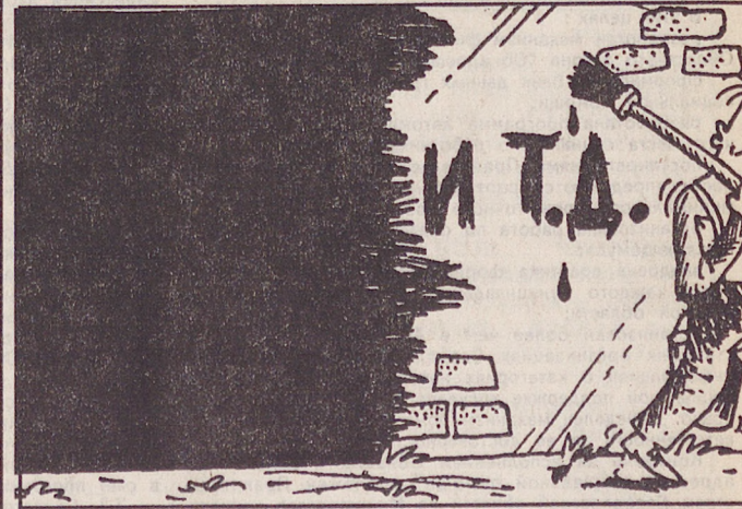
Рисунок Аркадия ПЯТКОВА.

В районе Екатеринбург-а 21 апреля восход Солнца — в 6.36, заход — в 21.18, продолжительность дня — 14.42; восход Луны — в 10.32, заход — в 2.39 фаза Луны новолуние.