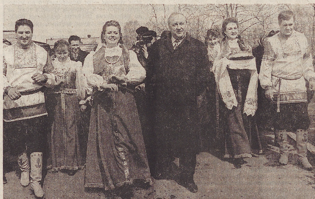
Так встречали губернатора Э.Росселя у ворот Покровского собора в Алапаевске.