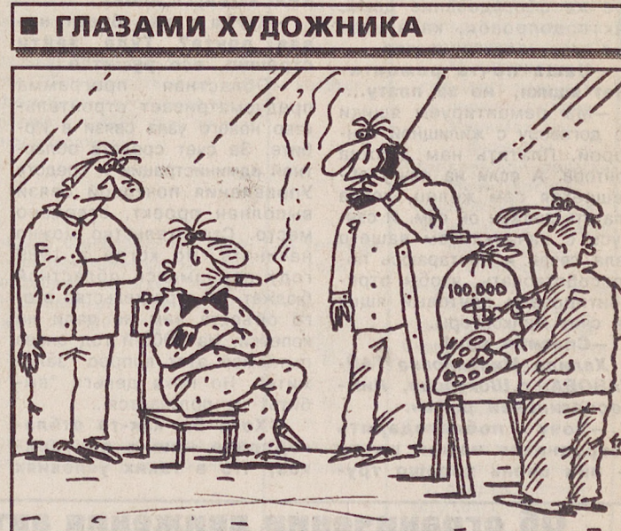
Рисунок Аркадия ПЯТКОВА.

В районе Екатеринбурга 14 апреля восход Солнца — в 6.54, заход — в 21.03, продолжительность дня — 14.09; восход Луны — в 6.44, заход — в 18.20, фаза Луны — последняя четверть 9.04.