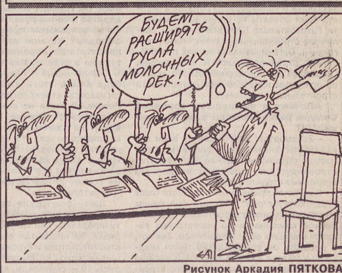
Рисунок Аркадия ПЯТКОВА.

Активный циклон несет тепло Атлантики. В ближайшие дни ожидается повышение температуры воздуха: ночью до минус 4... минус 9, днем до 0... плюс 5 градусов. Потепление будет сопровождаться сильным западным ветром и большими осадками.