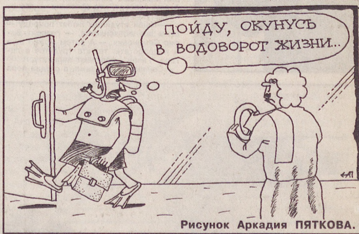
Рисунок Аркадия ПЯТКОВА.

В районе Екатеринбурга 20 марта восход Солнца — в 7.02, заход — в 19.10, продолжительность дня — 12.09; восход Луны — в 8.27, заход — в 22.46; фаза Луны — новолуние 17.03.