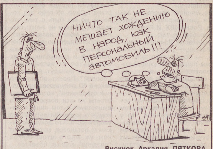
Рисунок Аркадия ПЯТКОВА.