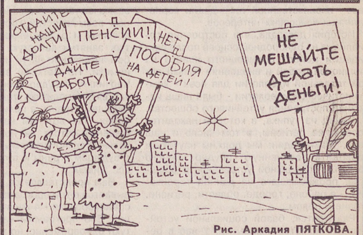
Рис. Аркадия ПЯТКОВА.