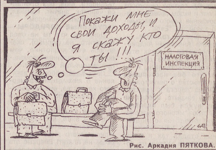
Рис. Аркадия ПЯТКОВА.

Погода Циклон не спешит покинуть территорию Урала. 3 февраля по области облачная и дождливая погода. Ветер юго-восточный, днем с порывами на северо-восток. Температура воздуха ночью — 13—18, днем — 8—13, на севере ночью — 23—28, днем — 18—23 градуса. В Екатеринбург ночью — 4—6, с понижением в течение дня до —8—10 градусов.