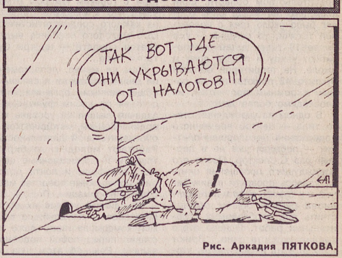
Рис. Аркадия ПЯТКОВА.