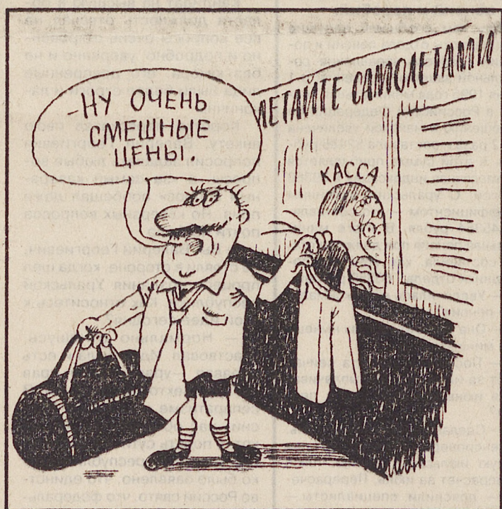
Рис. Леонида ЧЕРНЫХ.