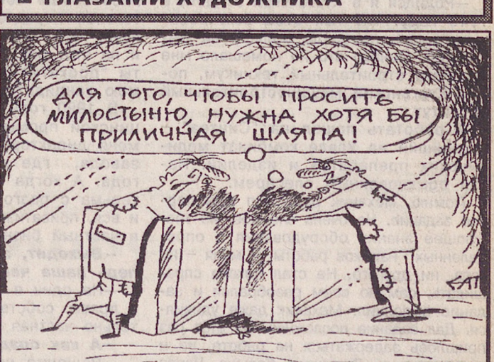
Рис. Аркадия ПЯТКОВА

В ближайшие трое суток на Урале будет ожидается неустойчивый ветер, в большинстве районов будут отмечаться небольшие снег, слабые метели, ветер западный 8-13 м/сек, порывистый. Температура воздуха постепенно повысится ночью от —10 —15 до —5 —10, днем от —4 —9 до 0 —5 градусов.