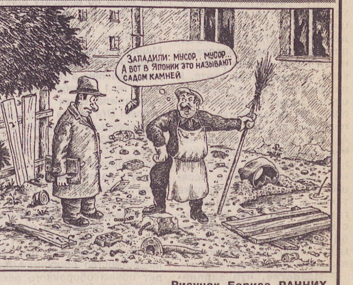
Рисунок Бориса РАНИК.