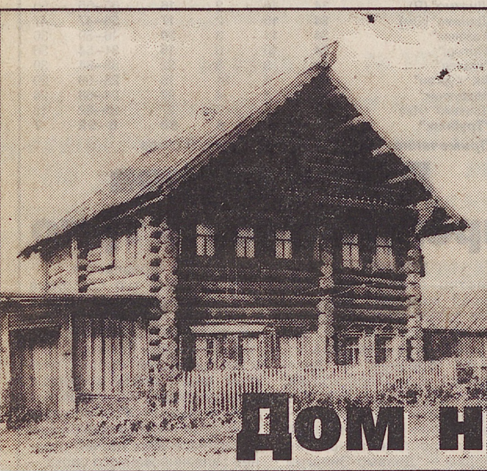
В СЕЛЕ Лучинкино Тугульмского района разорен ценнейший, областного и федерального значения, памятник уральского деревянного зодчества.