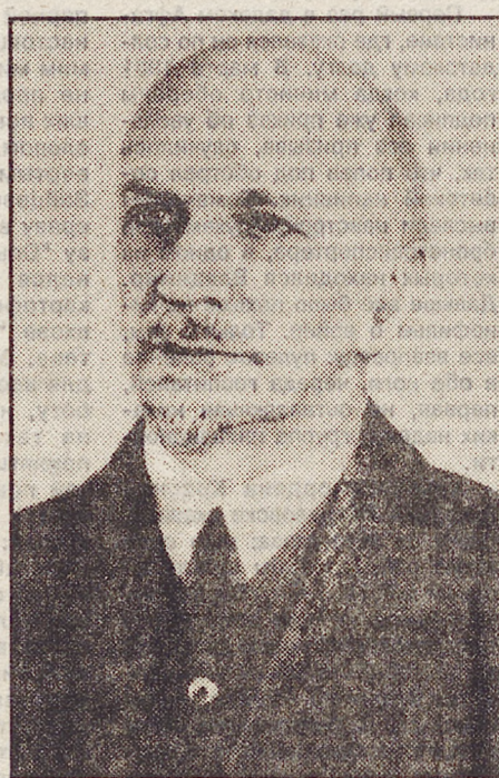
Иван Ильин.

Второй предпосылкой творческой демократии является достаточно высокий уровень правосознания граждан. Человек, сохраняющий здоровое правосознание, имеет волю к законопослушанию: он живет по праву. Гражданин, лишенный чувства ответственности, не способен ни к личному, ни к общественному самоуправлению, а потому не способен к демократии. Мыслитель