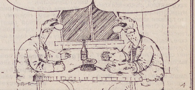
Рис. Алексея ЕВТУШЕНКО.