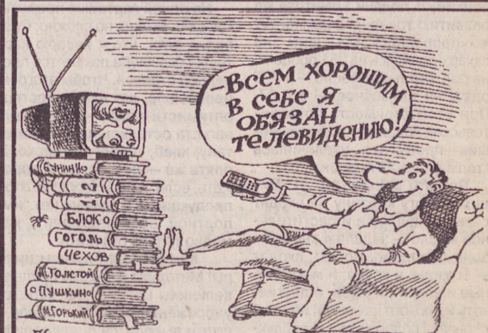
Рис. Игоря ЛЕВИТИНА.