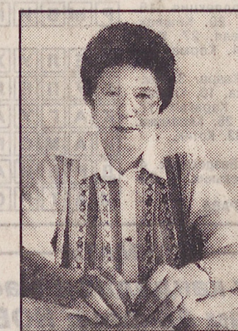
Очень важно, чтобы ребенок получил горячий завтрак. Так как во многих школах дотации на питание значительно уменьшены, эту задачу полностью должны взять на себя родители. И не просто бутерброд с чаем по утрам — завтрак должен содержать четверть суточной калорийности: это и каша, и яйцо, и хлеб с маслом. (Обед содержит 35-40 процентов суточной калорийности питания, полдник — 10-15, ужин — 20-25). Есть дети, которым не хватает четырехразового питания — ничего нет страшного в том, что они нездорово до сна съедят яблоко или выпьют стакан кефира.

Необходимое условие того, чтобы ребенок легко, естественно вписался в новую обстановку — это его здоровый внутренний фон, который создается прежде