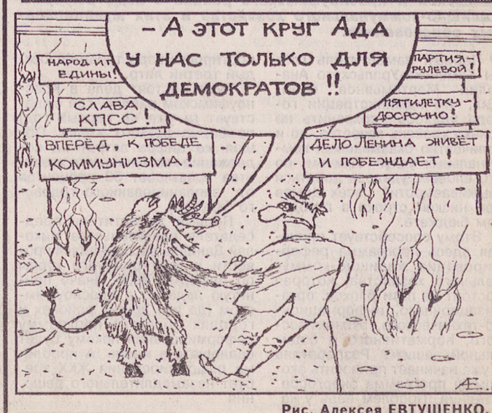
Рис. Алексея ЕВТУШЕНКО.