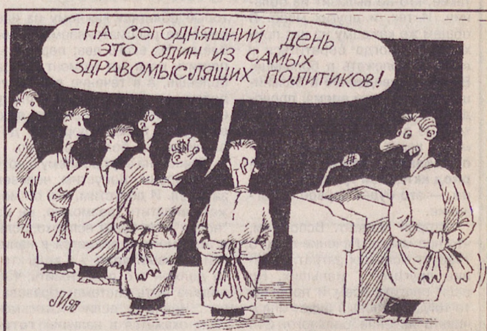
Рисунок Игоря ЛЕВИТИНА.