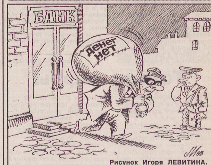
Рисунок Игоря ЛЕВИТИНА.

Погода В ближайшие трое суток сохранится перенос воздушных масс с европейской части России. 21 августа с прохождением атмосферного фронта будут отмечаться кратковременные дожди. 22-23 августа осадки прекратятся. Температура воздуха ночью +5+10, днем +14+19 градусов. Ветер западный 3-8 м/сек.