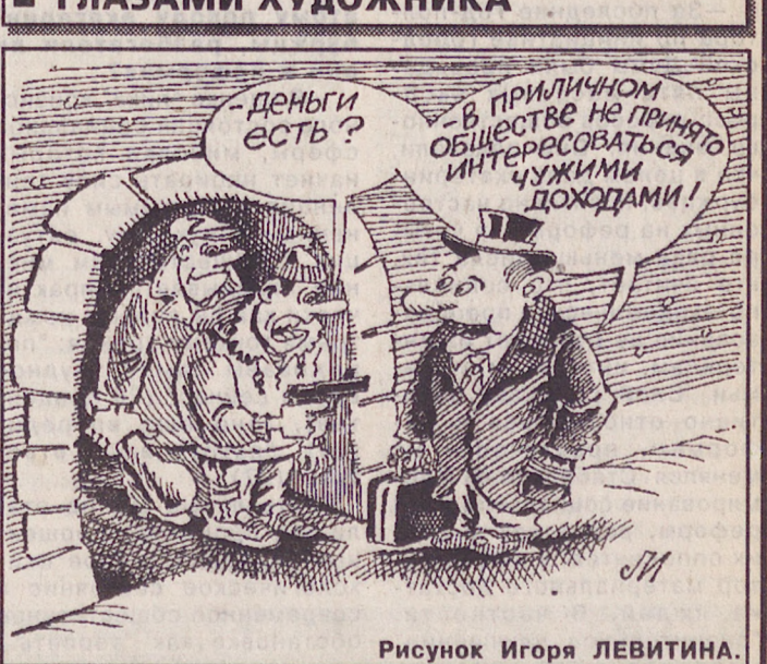
Рисунок Игоря ЛЕВИТИНА.