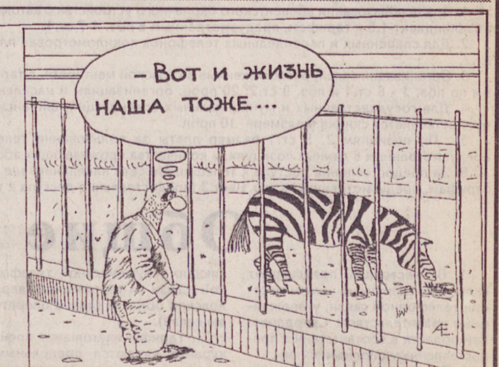
Рисунок Алексея ЕВТУШЕНКО.