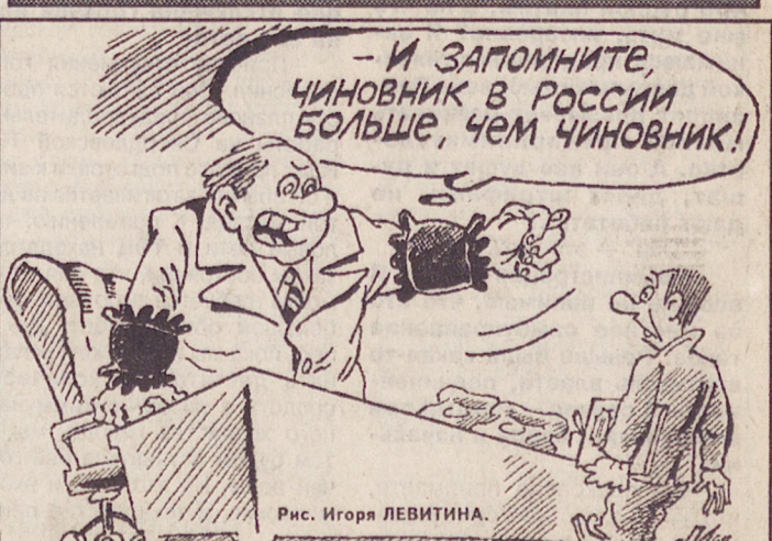
Рис. Игоря ЛЕВИТИНА.

Взаимовыручка. Несмотря на непростое положение в области, правительство решило оказать гуманитарную помощь Республике Саха (Якутия), огромный ущерб которой нанесла наводка. Предприятия области в счет уплаты налогов в бюджет предоставят Якутии продукты питания, лекарства, одежду, обувь и другие товары примерно на сумму 2 млн. 157 тыс. рублей. Кстати, ВСМПО (Верхняя Салда) собираются помочь северянам безвозмездно.