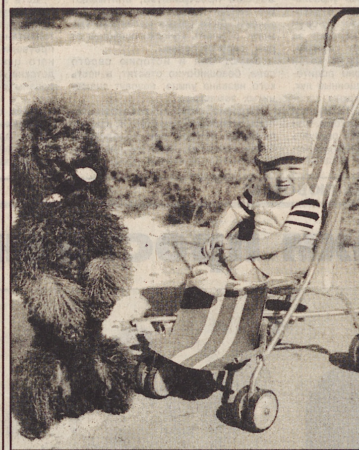
НЯНИ ВСЯКИЕ НУЖНЫ.