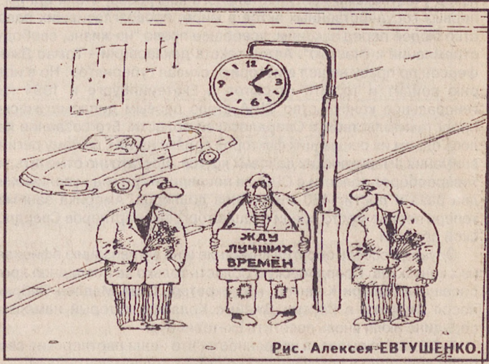
Рис. Алексея ЕВТУШЕНКО.