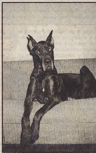
бременительной обязанностью для одних, стало несказанной радостью для других. А породистые псы опять оказались в меньшинстве.

Собачий бум неожиданно перекинулся в Китай. Раньше в Китае собак запрещали, сейчас разрешили. И у китайцев вспыхнула горячая любовь к большим породистым псам. В Екатеринбурге китайцы за породистого щенка дают 300 американских долларов, а за молодую собачку и все 500. Что оказалось