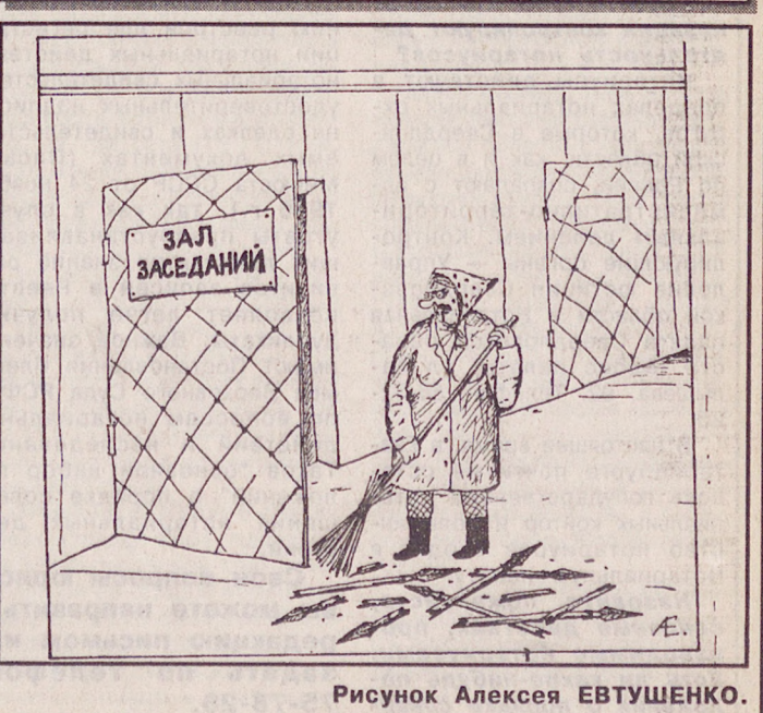
Рисунок Алексея ЕВТУШЕНКО.