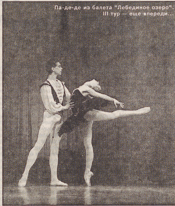
Па-де-де из балета “Лебединое озеро”. III тур — еще впереди...