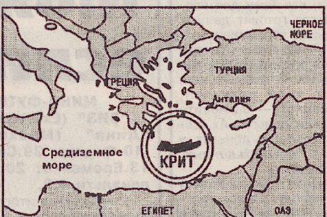
график рейсов: июнь — 05 и 19; август — 14 и 28; июль — 3, 17, 31; сентябрь — 11 и 25. Цена от 725$.

Отдых на Крите — это бесконечное движение. Безудно развлекать дает море. Разнообразные экскурсии заполняют ваше свободное время. Любителям древней истории предлагается поездка в Кносос — дворец, в лабиринтах которого проходил поединок Тесея и Минотавра. Родители с детьми с удовольствием проведут целый день в парках водных аттракционов, их на Крите три. Искателями приключений придется по вкусу путешествие на остров действующего вулкана — Санторини или поездка на джипах по острову. А можно просто побродить по извилистым улочкам старых городов, по-