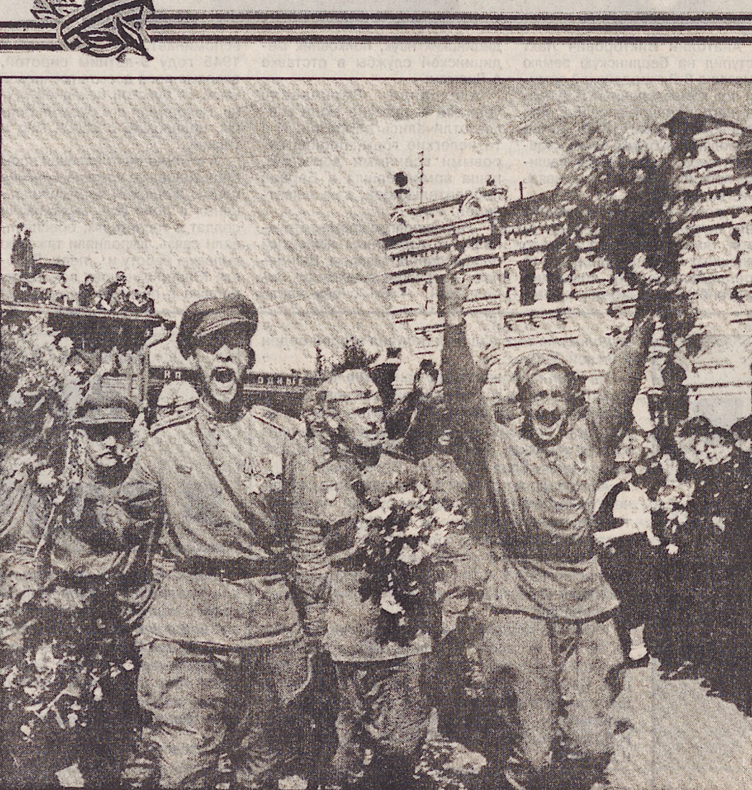
Встреча победителей в Москве. 1945 год.