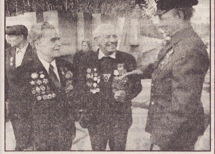
Встреча через годы.