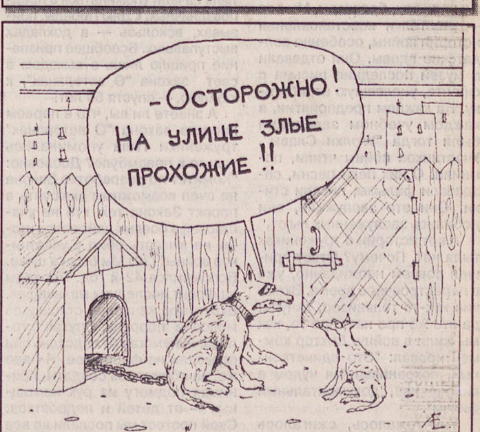
Рисунок Алексея ЕВТУШЕНКО.