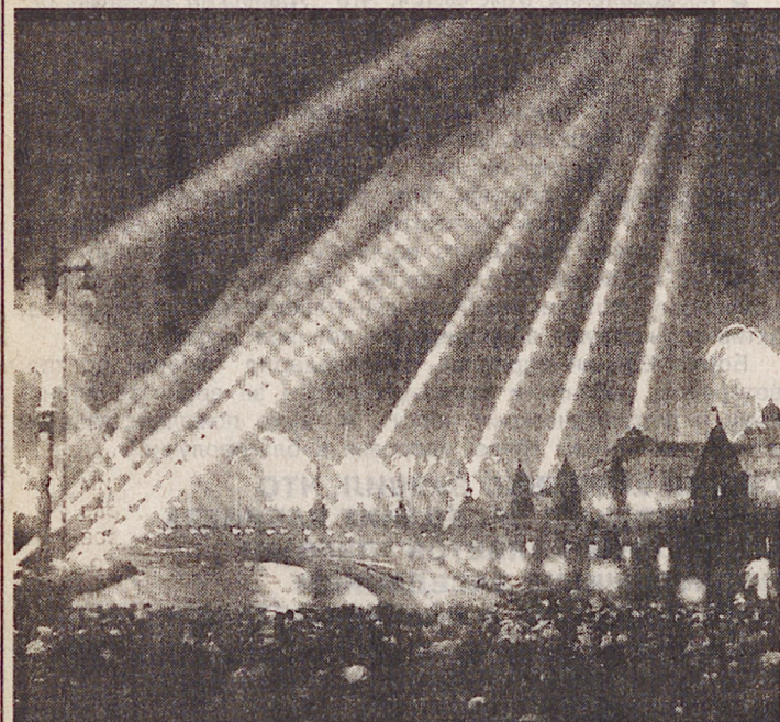
Салют Победы. Москва. 9 мая 1945 года.