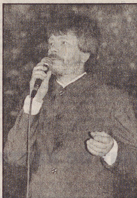
ослабла. Жизнь продолжается. Его дочке в день юбилея отца исполнилось 9 месяцев.

Наталья ПОДКОРЫТОВА.