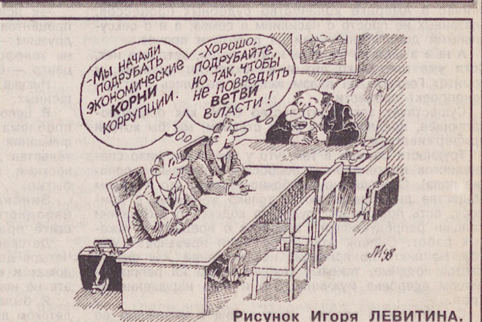
Рисунок Игоря ЛЕВИТИНА.