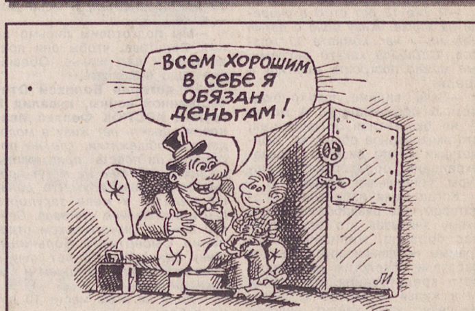
Рисунок Игоря ЛЕВИТИНА.