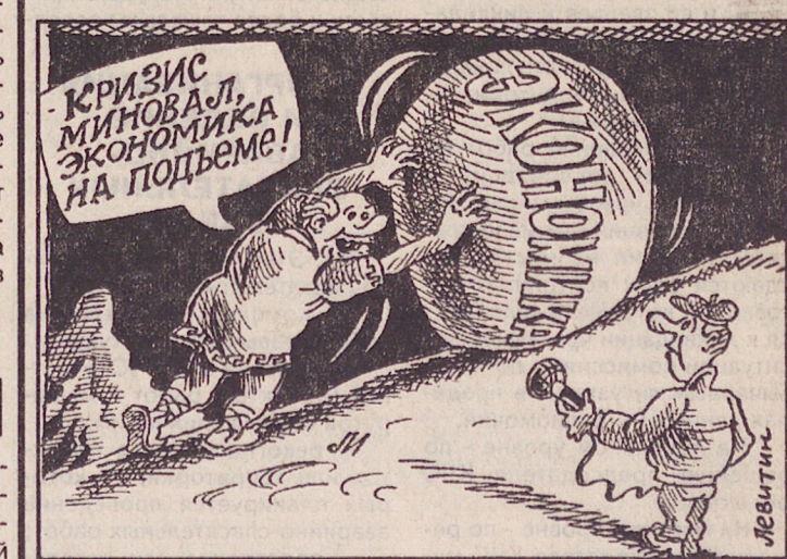
Рис. Игоря ЛЕВИТИНА.

Устойчивые западные ветры несут на полноватой влажной и теплой циклон. 8-9 апреля ожидается облачная погода с прояснениями, ночью 8 апреля без осадков, остальное время — небольшие осадки в виде дождя и мокрого снега, ветер юго-западный 7-12 м/сек. Температура ночью 8 апреля -5 — -10, днем +3 +8, 9 апреля ночью +1 — -4, днем +1 +6.