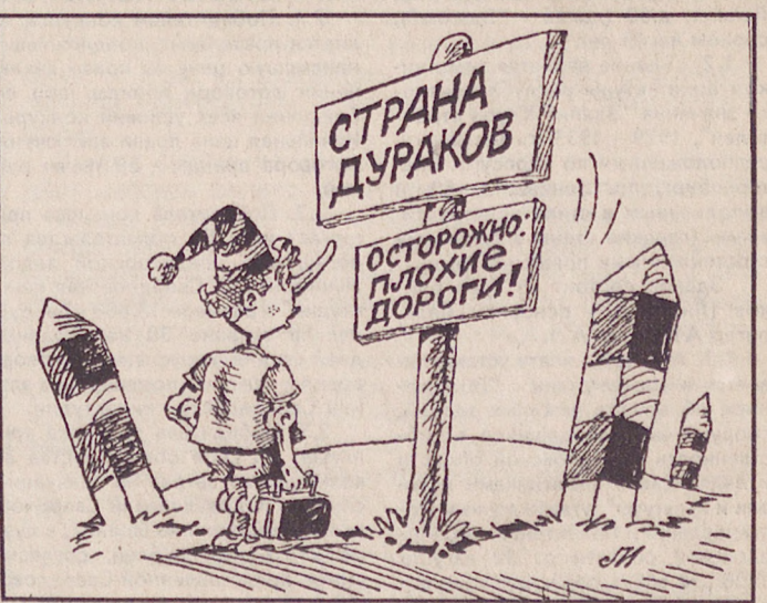
Рис. Игоря ЛЕВИТИНА.