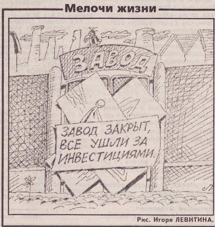
Рис. Игоря ЛЕВИТИНА.