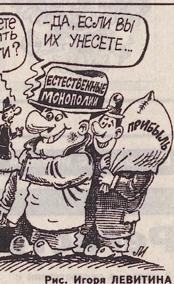
Рис. Игоря ЛЕВИТИНА

—Доходы от продажи квартиры не подлежат налогообложению в пределах 5000-кратной минимальной оплаты труда, или в сумме 417 тыс. денонминированных рублей. В том случае, если вы приобрете-