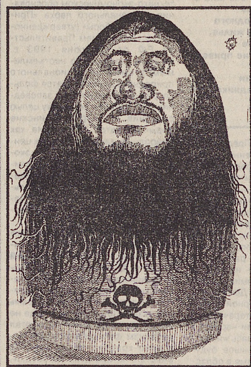
Асахара, лидер секты «АУМ-синрике».