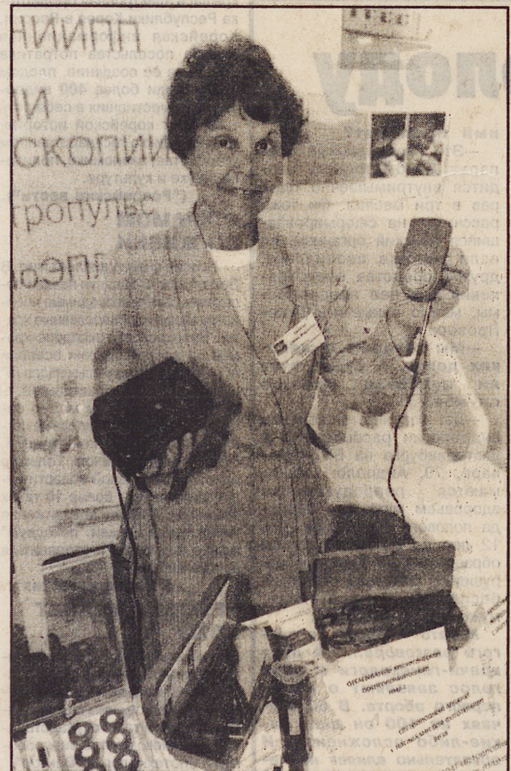
ТОМСК. Радар-детектор "Ими-авто" разработали и выпустили специалисты государственного научно-производственного предприятия "НИИПП" (Научно-исследовательский институт полупроводниковых приборов).

Владимир РОГАЧЕВ, корр. ИТАР-ТАСС в Нью-Йорке.