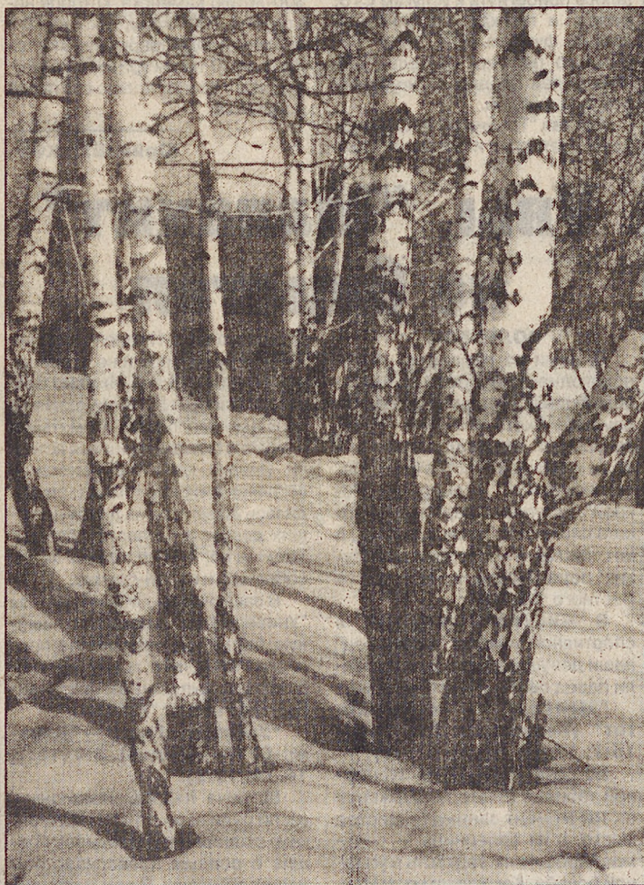
"Мороз и солнце! День чудесный..." Фото К.ШАПАЛИНА.