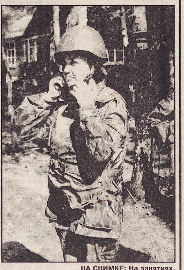
НА СНИМКЕ: На занятиях.