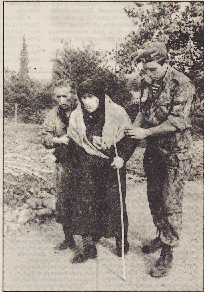
будет принимать адекватные меры по отношению к солдатам МС России."