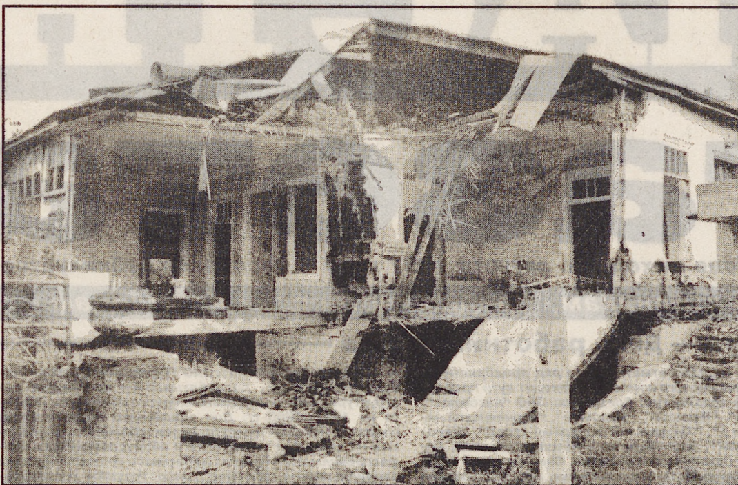
(Окончание. Начало в № 140). НА СОВЕЩАНИИ глав СНГ, которое состоится в сентябре, предполагается поднять вопрос о выводе миротворческих сил из зоны конфликта в Грузии.

Аудиторская фирма "Контур-Аудит". Тел/факс: (3432) 74-39-21.