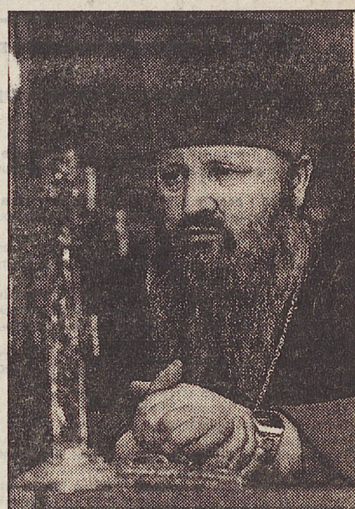
Победы пожелаете православным, всем уральцам?

— Что в канун светлого Христова Воскресенья, в преддверии всенародного праздника