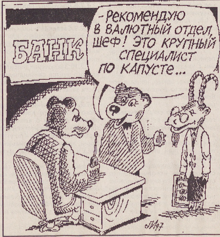
Рис. Игоря ЛЕВИТИНА.