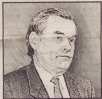
Пресс-служба Законодательного Собрания Свердловской области пригласила вчера журналистов на