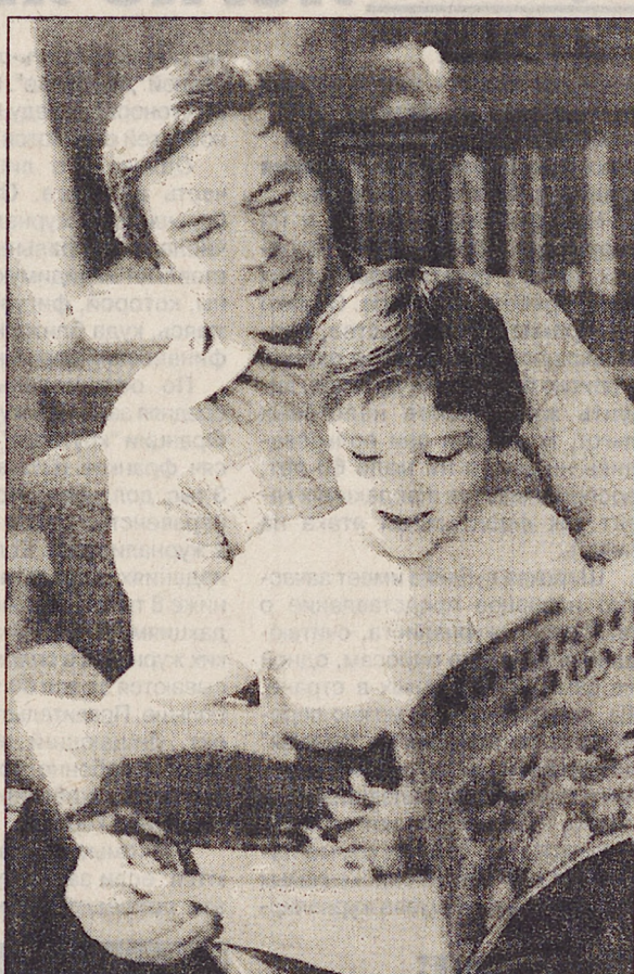
Будем надеяться, что несомненный талант русского сибирского писателя еще приведет к нам таких новых его героев.

—Задумки у меня есть, но говорить о них не буду. Мы, писатели, старались прививать читающей публике высокие нравственные, духовные качества, без которых не может быть Литературы. Но мы не учили умение постоять за себя, за свою страну. Это урок и надо учитывать, создавая новых литературных героев.