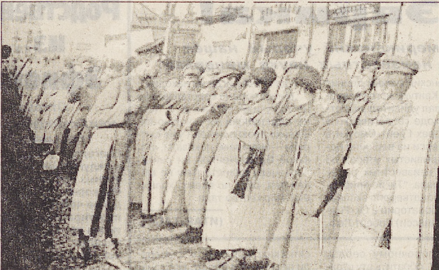
Неизвестная гражданская война

В общем, не надо быть Нострадамусом, чтобы понять — это явно не та цель, за которую боролись рабочие в Обухове, на Пресне, на Лене и на Выборгской стороне... Да и сам Ленин не строил иллюзий, говоря: "Мы знаем,