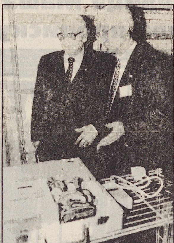
к снижению коммунальных платежей, но улучшит комфортность для больных и персонала. —Наше дело — дать полезную информацию, — говорят специалисты Энергоцентра. — А уж захотят ли семинаристы употребить эти знания по назначению, остается на их совести.

Врачей, как малых детей, убеждали в том, что эффективное использование энергии приведет не только